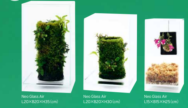
Neo Glass Air L20×B20×H35 (cm) Neo Glass Air L20×B20×H30 (cm) Neo Glass Air L15×B15×H25 (cm)

Terra Plate / Terra Plate Hook Die Terra Plate besteht aus dem selben keramischen Material wie die Terra Base. Auch sie schafft eine feuchte Atmosphäre. Man kann sie mit einem speziellen Haken am Neo Glass Air befestigen und so Epiphyten ganz besonders attraktiv präsentieren.